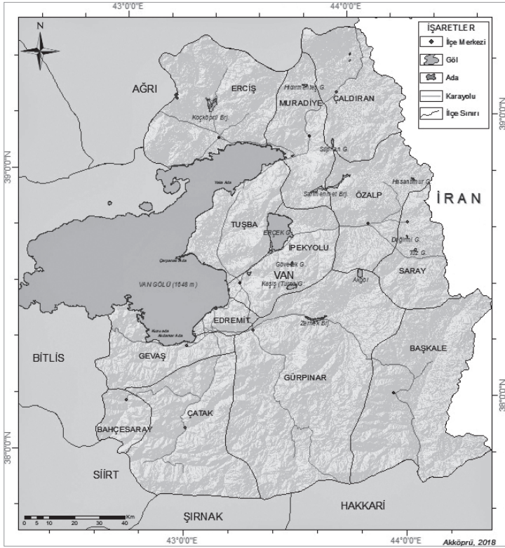
Şekil 1. Van ili lokasyon haritası.