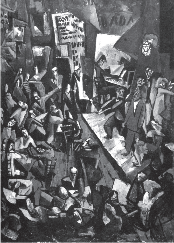
Dada'nın doğduğu, ilk Dada manifestolarının okunduğu ve performanslarının yapıldığı Zürih'teki Kabare Voltaire. Sahnede kurucular: Hugo Ball piyano çalıyor, Tristan Tzara ve Hans Arp önde, arkalarında Richard Huelsenbeck ve bu tablonun ressamı Marcel Janco, en arkada Emmy Hennings.